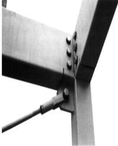
Şəkil 2. Ağillı ev – sökülə bilən əlaqə (solda), bina növlərindən biri (sağda).

onun çəkisi bir yük maşınında daşıma bilən maksimum çəkiyə çatmır (maksimum çəki 35.000 kq-dır). Ağillı evin bütün hissələri tək bir komponentə sökülüb yığıla bilər. (Şəkil 2) Komponentlərin istehsal və tikinti prosesinə qaytarılması ehtimalı nəzərdən keçirilir [4].